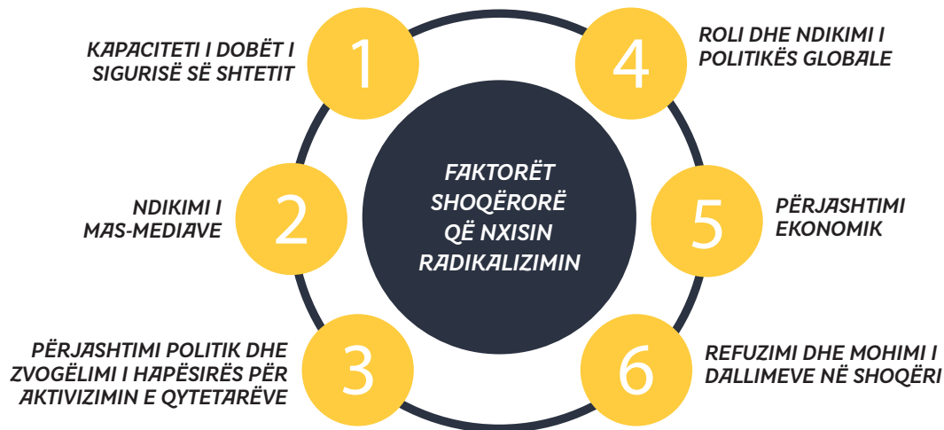
Ilustrimi 2 Faktorët (shoqërorë) strukturorë që nxisin radikalizimin

Këta faktorë nuk duhet të shqyrtohen në mënyrë individuale dhe të ndarë. Në bashkëveprim duhet të merren parasysh edhe faktorët individualë (Tjetërsimi dhe përjashtimi, zemërimi dhe frustrimi, dobësitë personale, kërkimi i identitetit dhe dinjitetit personal, hakmarrja për shkak të traumave të përjetuara paraprake, nënvlerësimet, mosrespektimi dhe keqpërdorimi etj.), të cilat kontribuojnë për radikalizimin e personave.