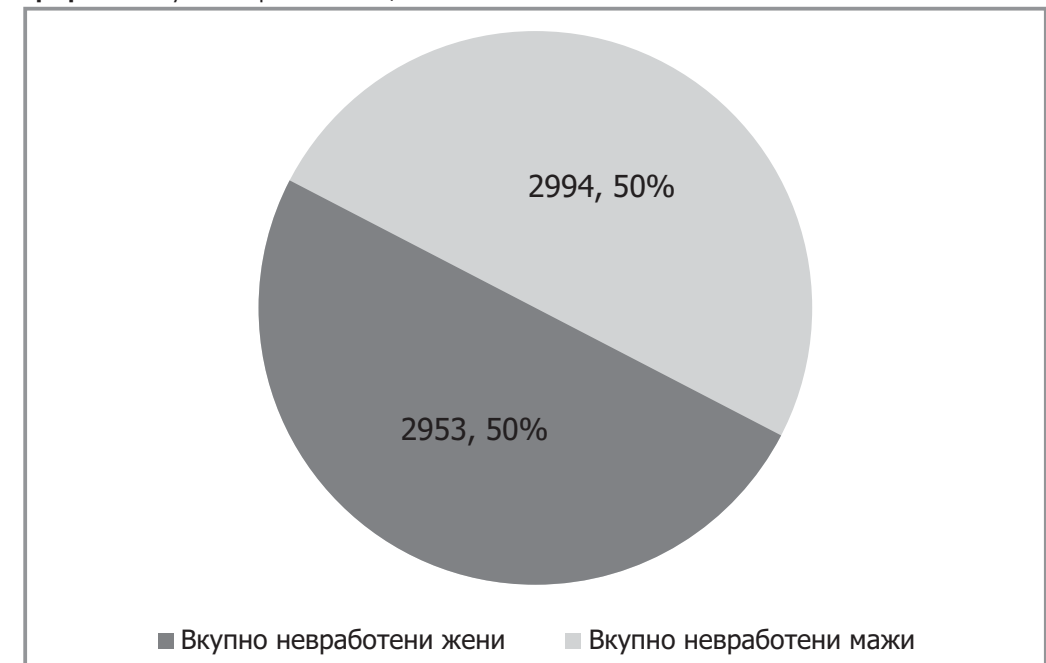
График 1 - Вкупно невработени лица во о. Битола

Во О. Битола, според податоците добиени од АВРМ заклучно со јули 2016год. има вкупно 5.947 невработени лица (График 1), од кои половина се невработени жени. Иако навидум изгледа дека мажите и жените подеднакво се справуваат со невработеноста, податоците прикажани во График 2 ни покажуваат дека тоа е случај со мажите и жените без образование и со средно образование, додека жените со високо образование се далеку позастапени во групата невработени од мажите (скоро 2/3 о вкупниот број невработени со високо образование се жени).